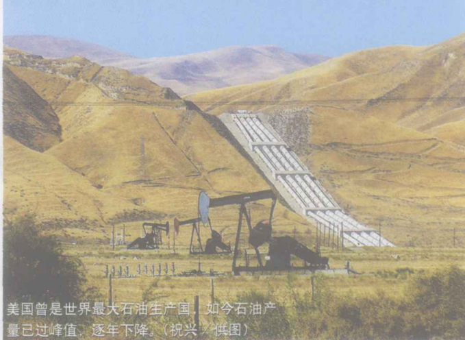
美国曾是世界最大石油生产国，如今石油产量已过峰值，逐年下降。

“石油枯竭论”是推高国际油价的一大舆论成因。追根溯源，其实“石油枯竭论”在147年的世界现代石油工业史中已经几度兴衰。